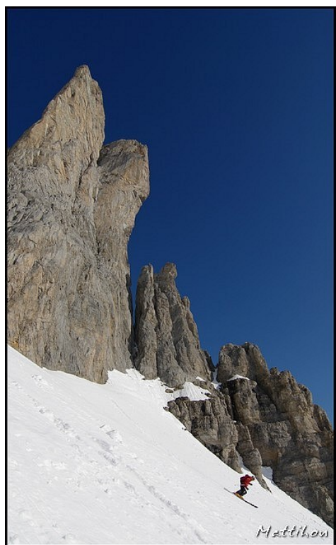
Ski sur fond d'Aguilles (skieur : S. Egea)