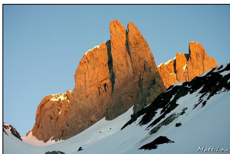
Pyrotechnie du matin sur les Aiguilles